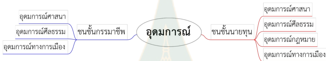
ภาพที่ 6.1 แสดงความสัมพันธ์ระหว่างอุดมการณ์ ชนชั้น และเนื้อหาของอุดมการณ์

ในสังคมทุนนิยมที่ชนชั้นหลักคือชนชั้นนายทุนหรือกฏุมพีและชนชั้นแรงงาน โดยชนชั้นนายทุนอยู่ในฐานะของชนชั้นปกครอง ชนชั้นทั้งสองต่างมีอุดมการณ์ที่มีเนื้อหาของตนเองได้ไม่ว่าจะเป็นอุดมการณ์ทางศาสนา ศีลธรรม การเมือง ยกเว้นแต่อุดมการณ์ทางกฎหมายที่มีแต่ชนชั้นหลักที่ควบคุมอำนาจรัฐถึงจะนำมาใช้ประโยชน์ได้ ความสัมพันธ์ระหว่างอุดมการณ์ตามชนชั้นและอุดมการณ์ตามเนื้อหาสามารถแสดงความสัมพันธ์ได้ดังนี้