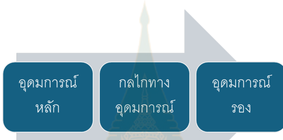
ภาพที่ 6.4 แสดงภาพความสัมพันธ์ระหว่างอุดมการณ์หลัก กลไกทางอุดมการณ์ และอุดมการณ์รอง

เราจะพบว่าการจัดความสัมพันธ์ระหว่างอุดมการณ์หลัก รอง ภายนอก ภายในได้ดังนี้ อุดมการณ์หลัก คืออุดมการณ์ภายนอก และอุดมการณ์รองคืออุดมการณ์ภายใน โดยอุดมการณ์หลักสร้างกลไกทางอุดมการณ์ และกลไกทางอุดมการณ์สร้างอุดมการณ์รอง โดยสามารถแสดงออกมาเป็นแผนภาพดังต่อไปนี้